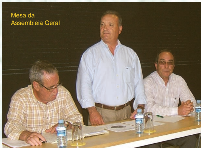
Mesa da Assembleia Geral

Fruto das negociações levadas a cabo pela Conde-